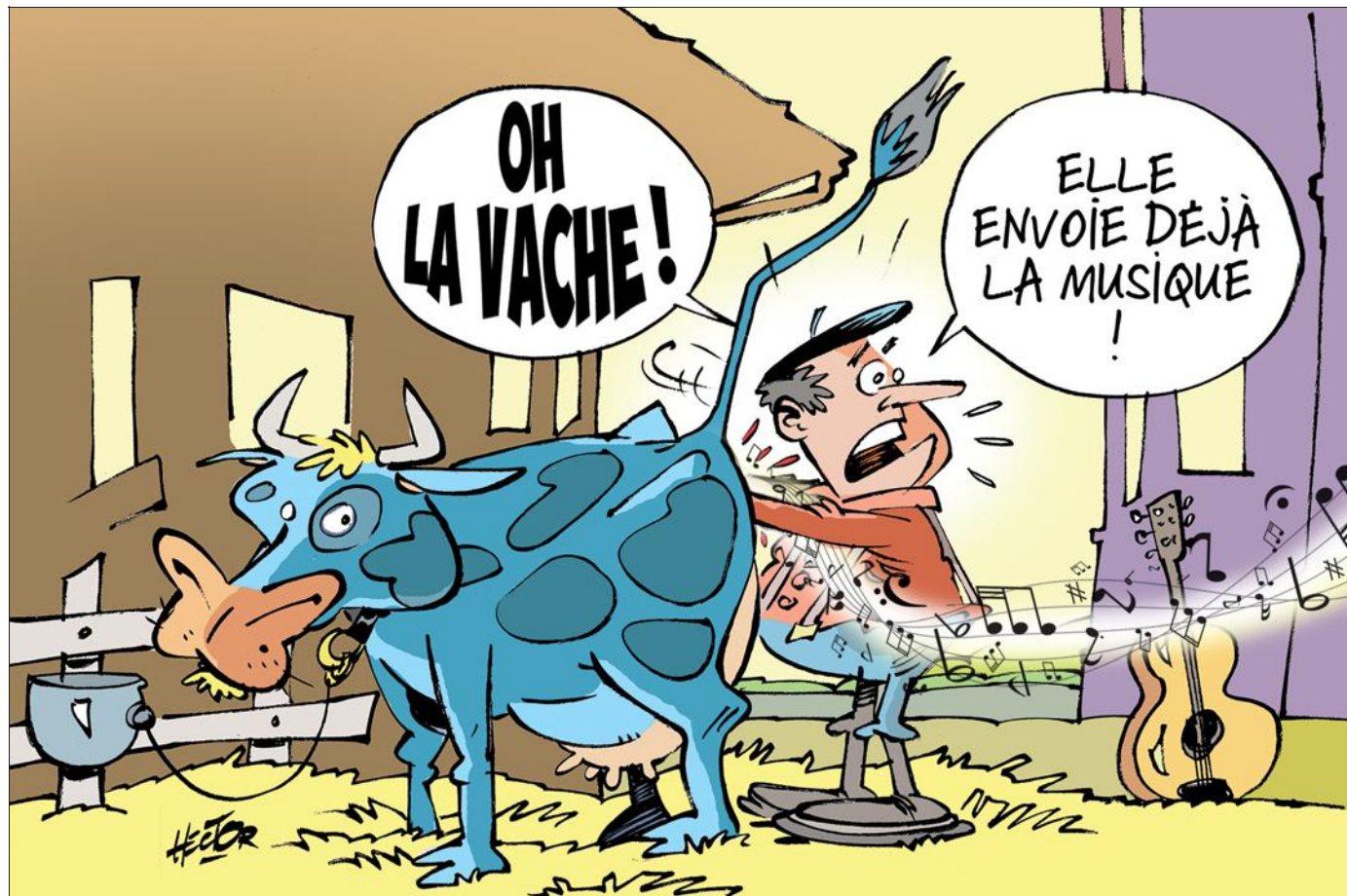
Eh oui : un bébé blues arrivera dès le mois de mars. Et un autre tous les mois, avant le festival de juillet...

Boostés par cette confiance, en vue de la quinzième édition, les responsables redessinent l'événement. Les fameux trois jours de juillet demeurent, avec un tarif agressif de 30€ (contre 50€ l'an dernier) et 15€ la soirée (contre 25€). Mieux : une douzaine de dates sont proposées ! « Un calendrier décentralisé, décrit le président Pierre Ennen. Ces échéances nous permettront d'exporter l'esprit Vache de blues. » Les concerts démarrent dès mars : Villerupt, Boulange,